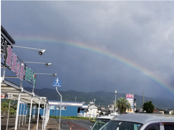
当日雨上がりの虹

7月30日（月）に四国労働金庫安芸支店会議室にて安芸地区労福協理事会が8名の役員と高知県労福協より来賓に参加していただき開催いたしました。