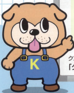
クンペル高知イメージキャラクター 「クンペルくん」