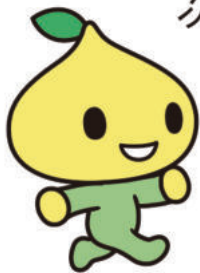
公式キャラクター ビットくん